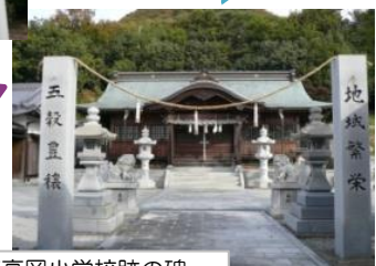
下高岡小学校跡の碑