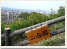
二合目からの景色

三木町のシンボル『白山』は、霊峰富士に似ており東讃岐富士ともよばれています。標高202.65mの美しい山で、四季の移りかわりで風情が変わり山麓一帯は史跡に富んでいます。全長667m、片道約20分のハイキングコースになっております。