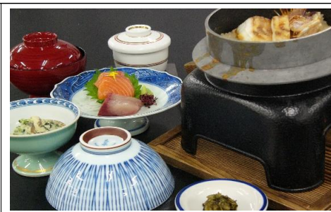
釜飯御膳 1,760 円(税込) 1,600 円(税抜)