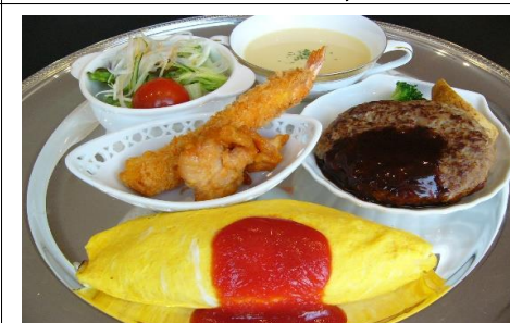
大人様ランチ 1,870 円(税込) 1,700 円(税抜)