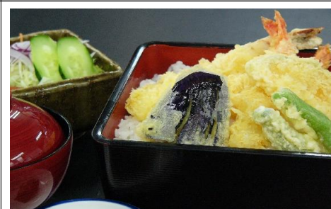
天重 1,210 円(税込) 1,100 円(税抜)