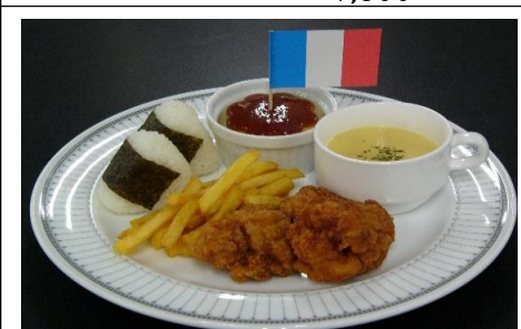
お子様からあげプレート 605 円(税込) 550 円(税抜)