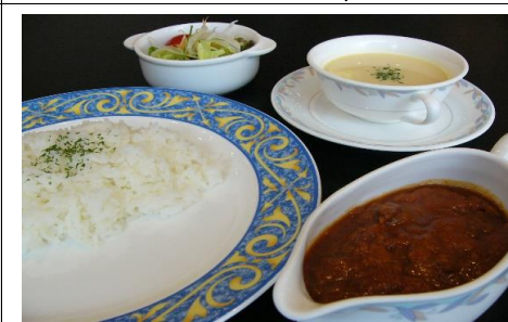
ビーフカレー 1,320 円(税込) 1,200 円(税抜)