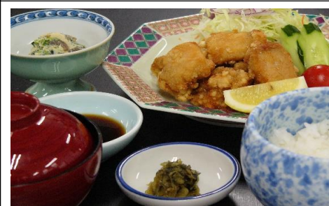
鶏唐揚げ定食 1,320 円(税込) 1,200 円(税抜)