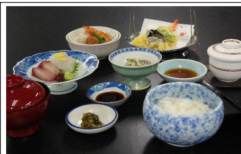
五色御膳 2,530 円(税込) 2,300 円(税抜)