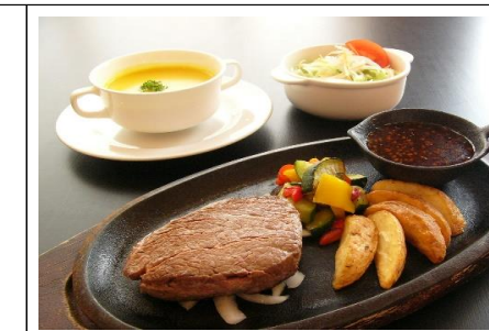
牛フィレステーキ 2,585 円(税込) 2,350 円(税抜)