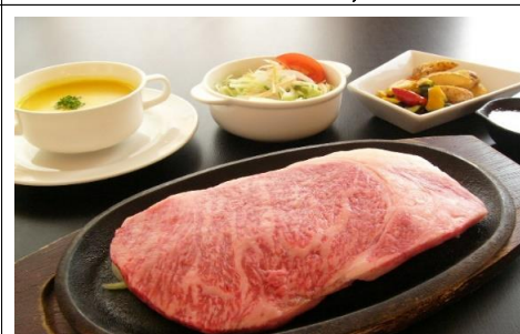
200g 5,005 円(税込) 4,550 円(税抜)