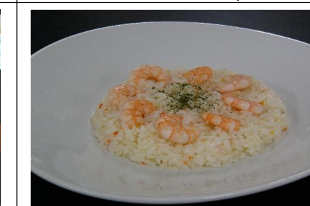
海老ピラフ 1,540 円(税込) 1,400 円(税抜)