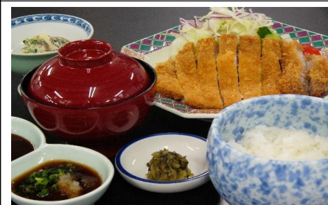
豚カツ定食 1,540 円(税込) 1,400 円(税抜)