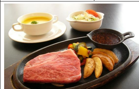
100g 2,915 円(税込) 2,650 円(税抜)