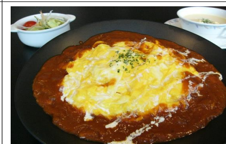
オムレツハヤシライス 1,540 円(税込) 1,400 円(税抜)