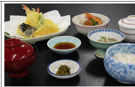
天ぷら定食 1,760 円(税込) 1,600 円(税抜)