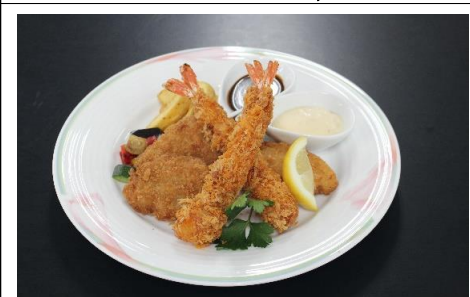
ミックスフライ 1,980 円(税込) 1,800 円(税抜)