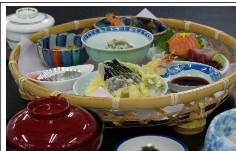
花籠御膳 1,980 円(税込) 1,800 円(税抜)