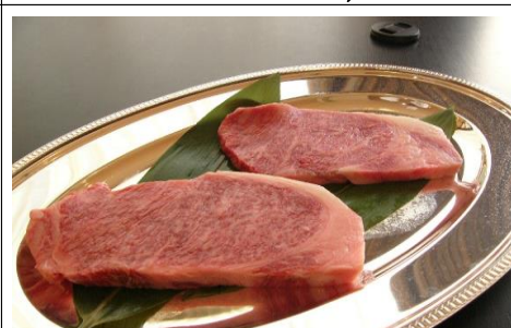
300g 7,260 円(税込) 6,600 円(税抜)