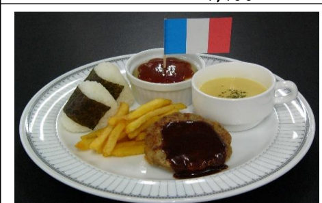
お子様ハンバーグプレート 605 円(税込) 550 円(税抜)