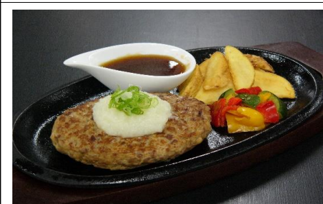
ハンバーグステーキ 1,540 円(税込) 1,400 円(税抜)