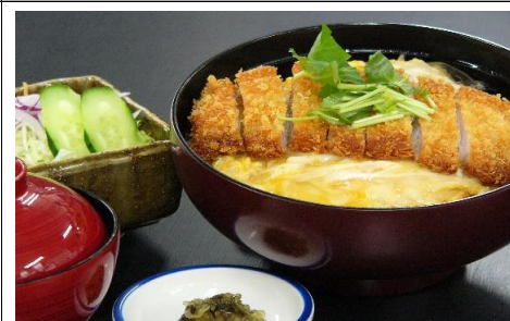
カツ丼 1,210 円(税込) 1,100 円(税抜)