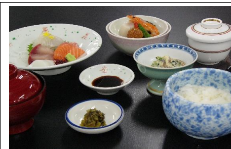
お造り定食 1,980 円(税込) 1,800 円(税抜)